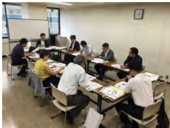
デザイン活用支援ツール研究交流会