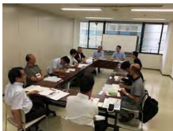
ものづくりデザイン研究交流会