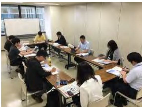
ユニバーサルデザイン研究交流会