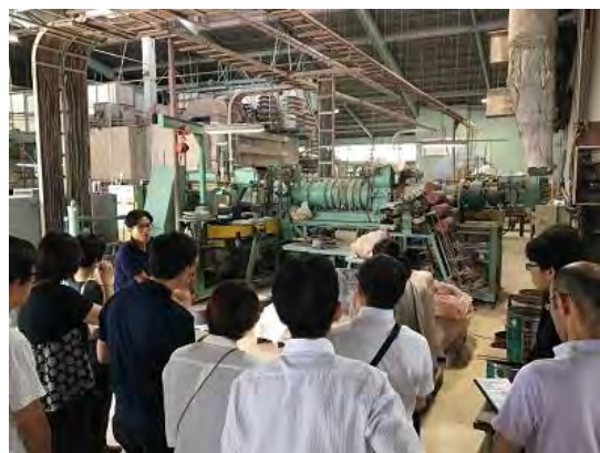
銀峯陶器株式会社