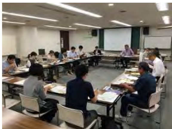
地域デザイン振興研究交流会

地域デザイン振興研究交流会（4階 視聴覚室）、ものづくりデザイン研究交流会（4階 研修室2）、ユニバーサルデザイン研究交流会（4階 研修室3）、およびデザイン活用支援ツール研究交流会（4階 開発室）の4研究会にわかれて、それぞれのテーマに基づき意見交換がなされた。